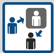
FONTI DEI DATI

I dati personali in nostro possesso vengono raccolti attraverso la navigazione sul nostro sito, a prescindere dalla richiesta o meno di informazioni, preventivi, formulazione ordini, iscrizione alla newsletter.