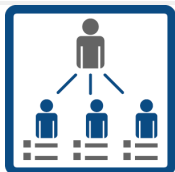
TITOLARE DEL TRATTAMENTO

Preghiamo l'interessato di leggere attentamente le presenti norme sulla privacy in modo da essere edotto sull'utilizzo dei suoi dati personali da parte del titolare.