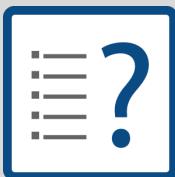
TIPOLOGIA DI DATI

Consideriamo inoltre legittimo interesse garantire la sicurezza del Sito e delle informazioni sullo stesso scambiate, ossia la capacità di tale Sito di resistere, a un dato livello di sicurezza, a eventi imprevisti o ad atti illeciti o dolosi che compromettano la disponibilità, l'autenticità, l'integrità e la riservatezza dei dati personali conservati o trasmessi e la sicurezza dei relativi servizi offerti o resi accessibili;